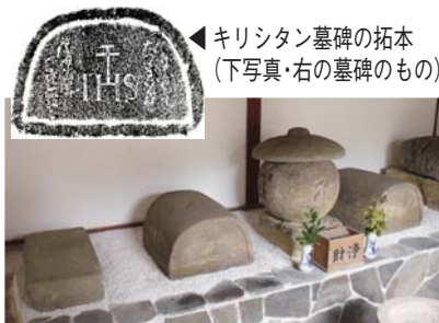
▲正覚寺のキリシタン墓碑群(4基)

なお、正覚寺が建つ地には、同寺建立前にキリシタンの布教活動の拠点となった「南蛮寺」(教会)があったと伝えられています。