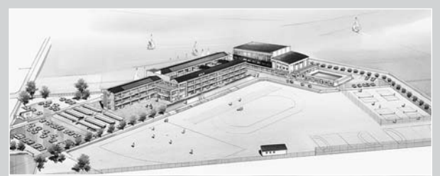
▲新「本渡中学校」のイメージ図

平成15年3月 本渡市学校規模適正化審議会が、市内の中学校を3校とする答申を提出。 平成16年1月 本渡市教育委員会が、市内の中学校を本渡東中学校・稜南中学校・新統合中学校の3校とする方針を決定。