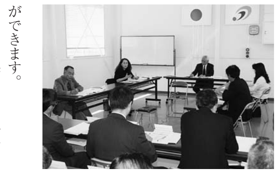
▲5月14日に開催された教育委員会会議

教育委員会の会議には、毎月開催する定例会と、特定の案件があった場合に開催する臨時会があります。会議では、次の事項などについて審議しています。 ●教育に関する事務の管理および執行の基本的な方針。 ●教育委員会の所管に属する学校その他の教育機関の設置および廃止。 ●教育委員会規則その他教育委員会の定める規程の制定または改廃。 ●教育予算その他議会の議決を経るべき議案について意見を申し出ること。