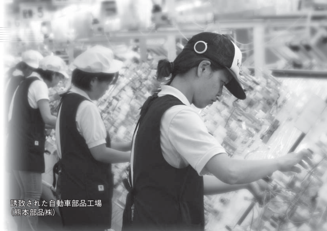
誘致された自動車部品工場 (熊本部品株)

厳しい雇用状況が続く天草。平成19年の有効求人倍率を見る と、本市と苓北町は0.41倍で、熊本 県平均の0.82倍、全国平均の 1.04倍を大幅に下回っています。 このような雇用状況を改善する ため、市や苓北町、地元経済団 体などが7月28日、「天草地域産 業・雇用創出協議会」を設立しま した。同協議会では、天草地域の 雇用創出を図るため、「企業誘致」 と「地場産業の振興」に取り組ん でいきます。