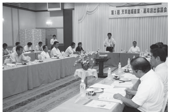
▲7月28日に開催された第1回天草地域産業・雇用創出協議会