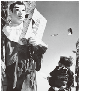
▲昭和30年天草産業博覧会での、巨大な天草四郎の着ぐるみ。