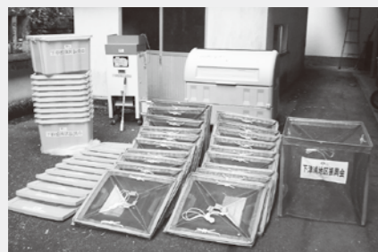
▲今回購入したリサイクル事業の備品