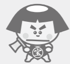
宝くじは、広く社会に役立てられています。

この事業は、同センターが宝くじ受託事業の収入を財源に、地域の人たちが自主的・主体的に行う地域づくりに対して、その費用を助成するものです。