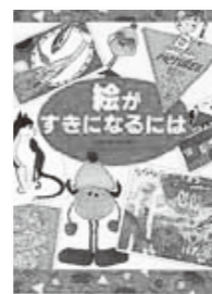
絵がたのしくかける本