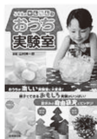
小学生のかんたん! おうち実験室