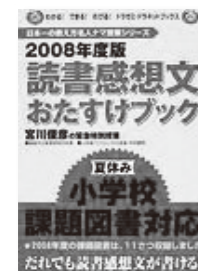
読書感想文おたすけブック2008年度版