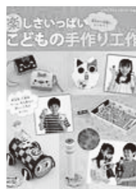
楽しさいっぱい 子どもの手作り工作