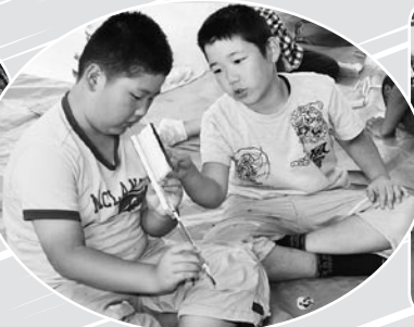
▲ネイチャークラフトで思い出づくり