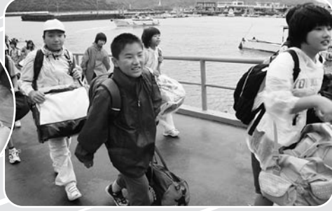
▲御所浦町に上陸、宿泊体験のスタート