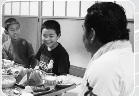
▲地元の民家では豪華な夜ごはんを堪能