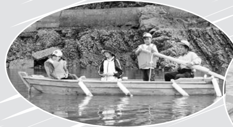
▲入り江で伝馬舟を楽しむ

御所浦町では、「子ども農山漁村交流プロジェクト」による宿泊体験活動が行われており、今年度は7校を予定しています。6月23日から同26日まで甲佐町立龍野小学校から14人、6月30日から7月3日まで若北町立田浦小学校から29人が参加。子どもたちは、地元の民家に寝泊りしながら、化石発掘や伝馬舟のろこぎなど「御所浦」でしか味わえないものを体験。ふだんとは異なる環境や人間関係の中での生活に、はじめはとまどいながらも、島を離れるころには別れを惜しむ姿がみられるなど、充実した体験になりました。