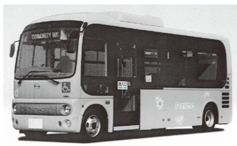
▲循環バス(イメージ)