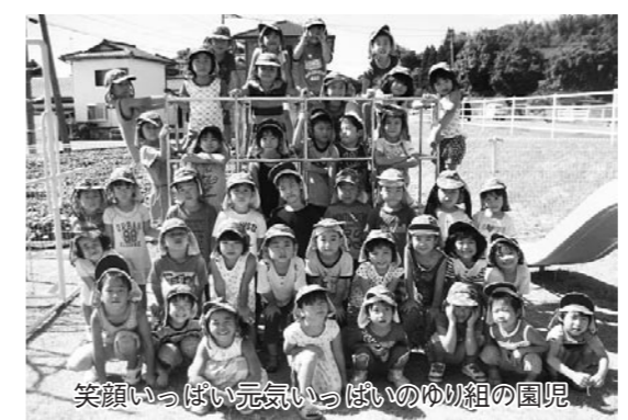
笑顔いっぱい元気いっぱいのゆり組の園児

中、1度目は焦がしてしまい大失敗。どうしてだろうと一人ひとりが考え、水の量を調節したり、根気強く混ぜ続けたりしながら、やっとジャムを完成させました。「やったあ」と大喜びの子どもたちの表情は、達成感でいっぱい。いろいろな体験を通して、子どもたちが自分で考え行動する力を身につけ、「自主性・意欲・思いやり」の心が育つよう、毎日過ごしています。