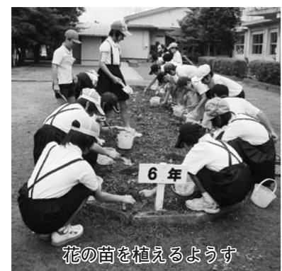
花の苗を植えるようす

らこれらの達人になれるようがんばっています。二つめは、「花いっぱい」の学校にしようです。本年度「人権の花運動」に全校児童で取り組んでいて、学年ごとの花壇やプランターに花を植えて大きくするように、草取りや水やりをがんばっています。そして、心の中にも、優しいきれいな花を咲かせたいと思います。私たちは、二つの取り組み