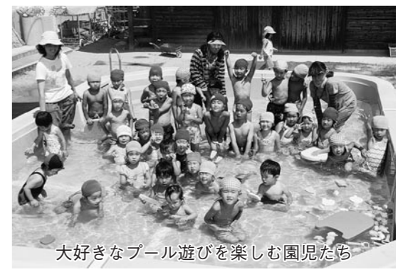
大好きなプール遊びを楽しむ園児たち

家業の醤油醸造の仕事に就いて2年目になります。学生時代などに麹菌について勉強したことを生かして、こだわりの「ものづくり」に励んでいきたいと思っています。趣味はドライブ。天草に帰ってきて、これまで知らなかった景色もたくさんあります。なかでも、天草町の西海岸の風景がとてもいいですね。