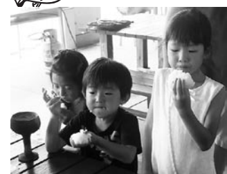
▲作った塩でにぎったおにぎりおいしいね!!