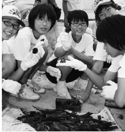
▲じょうずにできた竹炭