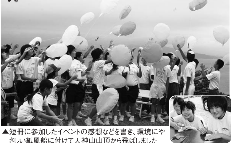
▲短冊に参加したイベントの感想などを書き、環境にやさしい紙風船に付けて天神山山頂から飛ばしました