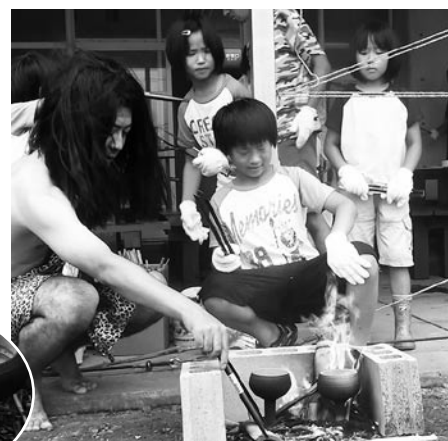
▲古代の塩作りに縄文人? (左)も登場!!