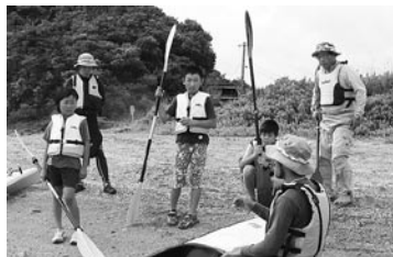
▲シーカヤックの乗船方法の講習を受ける参加者