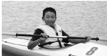
▲海の散歩を楽しむ子ども