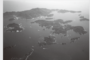
▲空から見た御所浦町全景