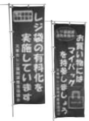
▲この旗が参加店の目印です。

市レジ袋削減推進協議会では、資源を大切に、将来により環境を残すため、レジ袋有料化、マイバッグ推進運動によるレジ袋削減推進にご協力いただける参加店を募集します（現在の参加店については市ホームページに掲載）。 申込方法 参加申込書を出してください。