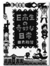
E高生の奇妙な日常 田丸雅智