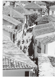
◀オビドスの家並み(城壁の上から)