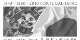
1543-1860-2010 PORTUGAL-JAPAN ▲日本ポルトガル修好150周年記念