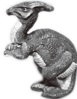
▲パラサウロロフス