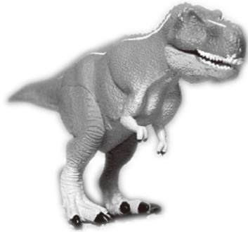
▲ティラノサウルス