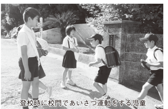
登校時に校門であいさつ運動をする児童

◆健康の秘けつは？ 魚釣りの道具作りや網の修理などで手先を動かすこと。また、できるだけ自分の足で歩くことを心がけており、自宅から近くにある旅館までの約1kmの道のりを、ほぼ毎日歩いています。