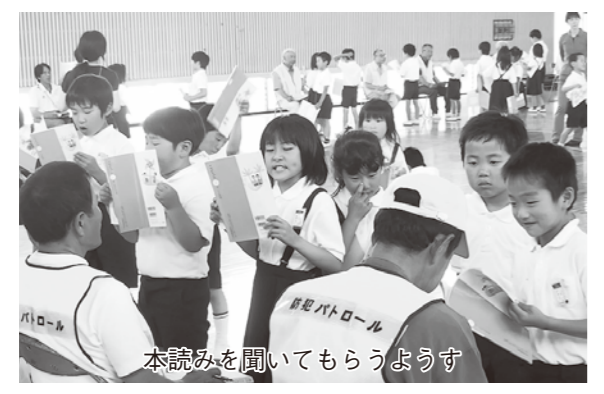
本読みを聞いてもらうようす

2かい目は、「歩く」というかん字をまちがえてしまいました。でも、おじいちゃんが、「がんばったね」と言ってくれました。うれしかったです。おじいちゃんおばあちゃんも、うれしそうでした。