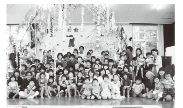
おじいちゃん、おばあちゃん、だ〜いすき!!