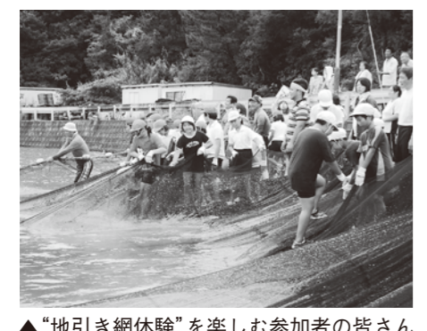
▲「地引き網体験」を楽しむ参加者の皆さん

御所浦北地区は、少子高齢化に伴う定住人口の減少や、地域産業である漁業の低迷など深刻な問題を抱えており、以前のような活気がなくなっています。このような中、御所浦北地区振興会では、地域に元気を持つてもらおうと、子どもからお年寄りまでがいっしょになって参加できる事業を実施しています。その一つは、地区の小学生を対象にした「地引き網体験」です。学校とPTAが中心となって準備をして、島の入江で行います。当日は、子どもたちがいっしょけんめい体験する姿を見ようと、たくさんの方が見物に来ます。また、ウォーキング大会やヤングラウンドゴルフ大会にもたくさんの方が参加するほか、小