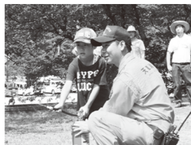
防災計画の策定のために