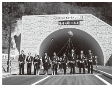
住みよいまちづくりのために