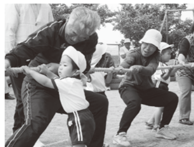
少子高齢社会に対応した政策のために