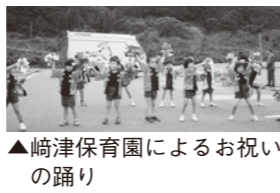
▲崎津保育園によるお祝いの踊り