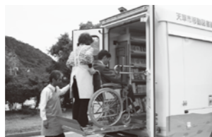
▲車いすでも乗車でき、本がゆっくり選べます