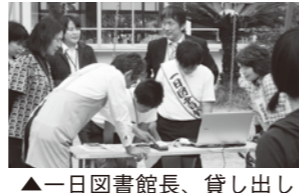
▲一日図書館長、貸し出しをがんばりました