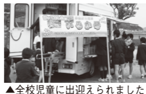
▲全校児童に出迎えられました