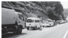
▲混雑しているようす

年末、大掃除などで出る家庭ごみは、できるだけ地区のステーションに出してください。例年、各清掃センターやクリーンセンターへの持ち込みは、2時間以上かかる場合があります。ご協力をお願いします。なお、ごみを持ち込むときは、市の指定ごみ袋に入れたり、シール券をはったりする必要はありませんが、使用料が必要となります(資源物は無料)。※持ち込む場合は、燃やせるごみ・燃やせないごみ・資源物に分別して出してください。