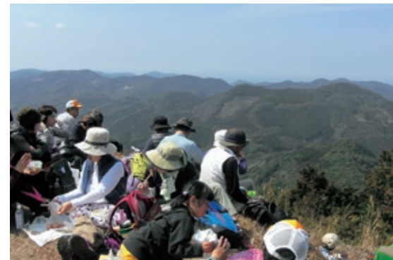
▲山頂で弁当を食べる参加者

3月19日、天草町の福連木子守唄公園から角山山頂までの約4kmを往復する「角山官山ウォーキング」が開かれ市内外から110人が参加しました。広大な国有林にかしの木などが自生し、歴史的にも貴重な角山官山を知ってもらおうと福連木づくり振興会が開催し、今回で5回目。参加者は、道中の落ち葉を踏みしめながら尾根沿いのコースを歩き、山頂では目の前に広がる風景を楽しみながら、お弁当を食べていました。