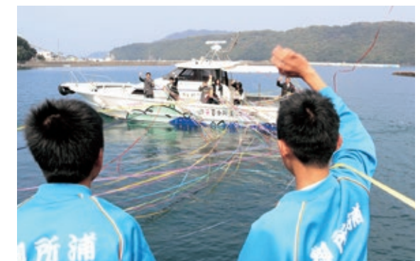
▲手を振って見送るようす

4月の定期異動で御所浦町を離れる御所浦小・中学校の9人の教員が3月30日、御所浦港と横浦港で児童・生徒や保護者など約100人から見送られました。