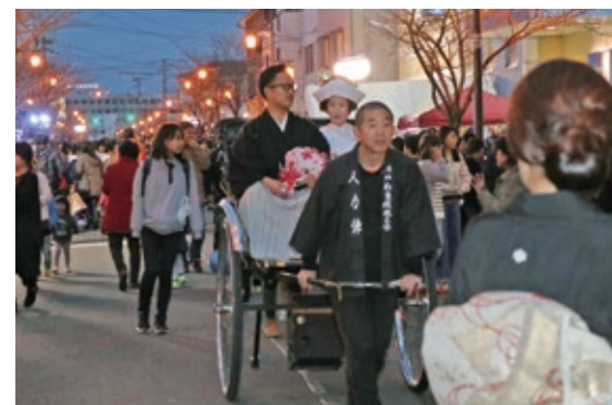
▲みんなから祝福を受ける2人

3月25日の夜、本渡地域の繭姫通りで「繭姫通り女の夜祭り」が開催されました。同祭り実行委員会が、明治初期に繭工場があったことにちなんで開催し、今回で14回目。歩行者天国になった通りは飲食店などの屋台が並び、多くの家族づれや若者たちでにぎわっていました。夕暮れ時には繭姫様やお稚児さん、巫女さんが先導して挙式後の新婚カップルを乗せた人力車が登場。通りを練り歩き、多くの人々の祝福を受けていました。