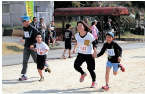
▲笑顔でゴールする参加者

2人そろってゴールする「第31回宮田ペアマラソン大会」が、3月19日倉岳町の宮田グラウンドをスタート・ゴールとする3kmのコースで開催されました。同大会実行委員会が、参加者の健康と体力の向上や親睦と融和を深めることを目的に毎年実施しているもの。今回は熊本地震で被害が大きかった益城町の小学校から10組が招待されたほか、過去最多の243組が参加し、早春の宮田の海岸線を仲良く走りました。