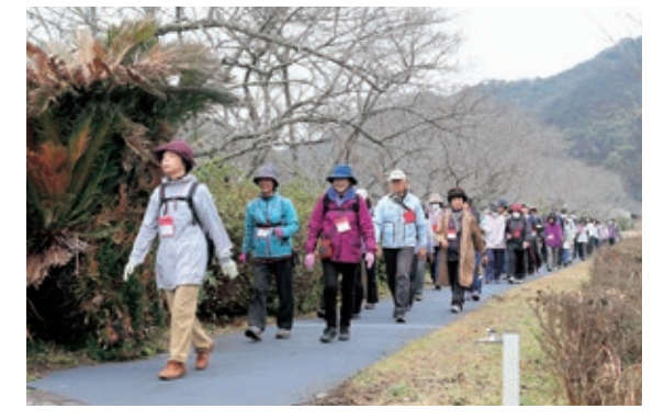
▲コースを歩く参加者

3月25日、河浦町の一町田地区振興会主催の「一町田さくらまつり」が同地区コミュニティセンター周辺で開催されました。同センター集会室では、小・中学生や高校生、天草吹奏楽団による青少年音楽祭が行われ、ピアノや吹奏楽の演奏で来場者を楽しませました。また、一町田川沿いを歩く5km、河内浦城跡公園から街中を展望する3kmコースのウォーキングに約160名が参加し、心地よい春の1日を満喫しました。