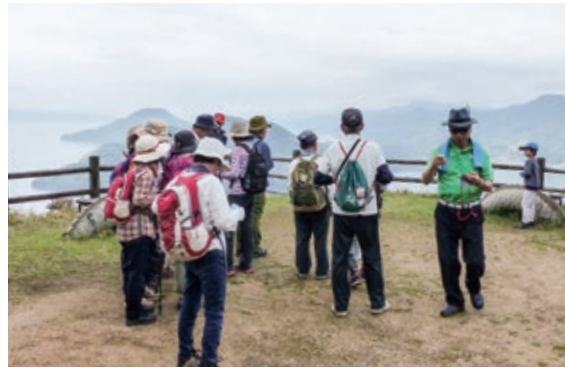
▲山頂から望む不知火海

4月16日、新和町の“竜洞山みどりの村”を主会場に「第12回竜洞山健康ウォーク」が開催されました。竜洞山フェスティバル実行委員会が開催し、不知火海の美しい眺望が楽しめる5・10kmの2つのコースに計265人が参加。新緑の香る中、思いおまいのペースで風光明媚な景色を楽しみながら歩いていました。参加者は「きつかったけど、達成感があり、気持ちよかったあ」と満足げに話していました。