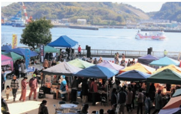
▲牛深会場のようす

3月19日、「うしぶか海食祭withキビルフェス」がうしぶか海彩館と鹿児島県の長島町・杉本酒造にて開催されました。地元の名産品をはじめ雑貨など約50店舗が出店。コラボ企画として、牛深の塩と長島のじゃがいもを使ったスイーツ「キビルリング」を販売。また、両会場を訪れてもらおうと牛深～蔵之元間のフェリー料金が往復500円で利用でき、多くの来場客でにぎわいました。