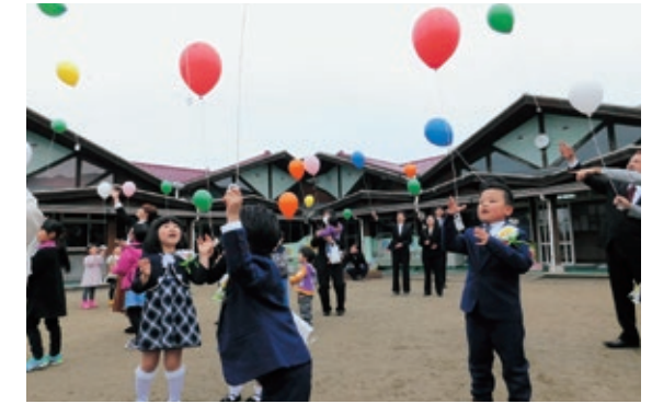
▲風船を飛ばす園児たち

3月25日、有明町の市立島子保育所で、卒園式と閉所式が行われました。昭和35年に開所し、57年間で延べ1,089人が卒園しました。式には、在園児や保護者、歴代保育所長、卒園児も出席。在園児たちは歌を合唱し、卒園児たちは空手やピアノ、太鼓の演舞などを披露しました。最後には出席者全員で、花の種のついた風船を飛ばし、別れを惜しんでいました。4月からは民間の島子保育園として開園し、新たな歴史を刻みます。