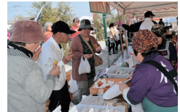
▲がねあげを試食する来場者

3月26日、五和町の鬼池港ターミナル裏芝生広場で「鬼池港物産市」が開催されました。五和地域の農産物や加工品などの販売促進を目的に五和まちづくり協議会が初めて開催したもの。会場には、こっばもちやがねあげ、五和沖で獲れたウニやなまこなどが並び、来場者はお目当ての商品を買い求めていました。この日は、同会場を発着とする「鬼池天神山潮風ウォーキング」も開催され、会場は多くの人で賑わいました。