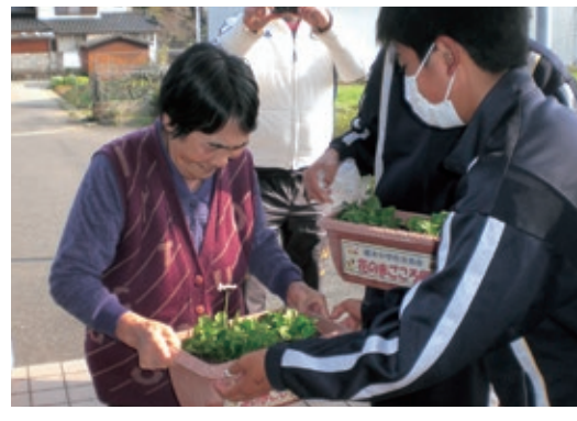
▲花のプランターを手渡す中学生

3月21日、栖本中学校生徒会が、自分たちで育てた花を「花のまごころ便」として地域の福祉施設などへ贈りました。日ごろからお世話になっている人への感謝の気持ちを表すこと、自主的で責任ある行動を目指すこと、地域の人とのつながりを深めることを目的に、10数年前から行っているもの。今回はデージーを植えたプランターを町内12カ所の福祉施設などに届け、たくさんの笑顔の交流ができました。