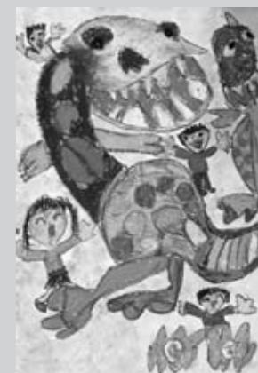
▶ 昨年の恐竜絵画コンテスト作品

※入賞作品は、7月15日(土)から9月3日(土)まで、御所浦白亜紀資料館で展示する予定です。