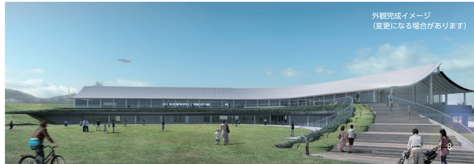
外観完成イメージ (変更になる場合があります)