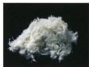
白石綿(クリンタイル)