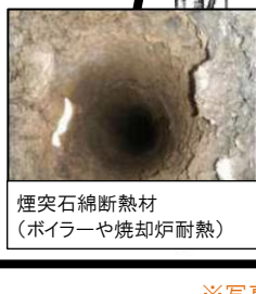
煙突石綿断熱材 (ボイラーや焼却炉耐熱)