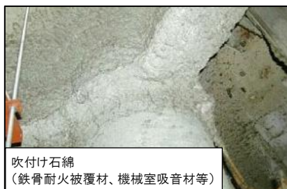
吹付け石綿 (鉄骨耐火被覆材、機械室吸音材等)

これら吹付け材の中には、施工された時期によってはアスベストを含むものが使われている可能性があります。