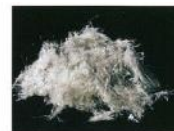
茶石綿(アモサイト)