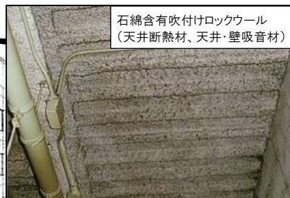
石綿含有吹付けロックウール (天井断熱材、天井・壁吸音材)