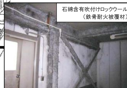
石綿含有吹付けロックウール (鉄骨耐火被覆材)

※写真のものと見た目は同じですが、アスベストを含まない吹付けロックウールは近年でも多く施工されています。 アスベストを含まない吹付けロックウールには、飛散防止や除却等の対策は必要ありません。