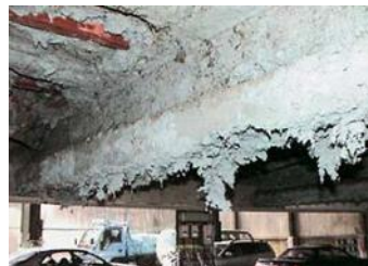
劣化した吹付けアスベスト

吹付けアスベストとは、アスベストにセメント等と水を加えて混合し、吹付け施工されたもので、壁や天井等の防火・耐火、吸音性能等を確保するために幅広く用いられました。この他にもアスベストの含有が0.1%を越える吹付けロックウール、吹付けひる石、パーライト吹付け等があり、これらを含めて「吹付けアスベスト等」といいます。アスベストを含む建材には様々なものがありますが、その中でも吹付けアスベスト等は、劣化や損傷によってその繊維が空気中に飛散しやすくなります。