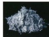
青石綿(クロシドライト)