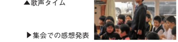
▶ 集会での感想発表