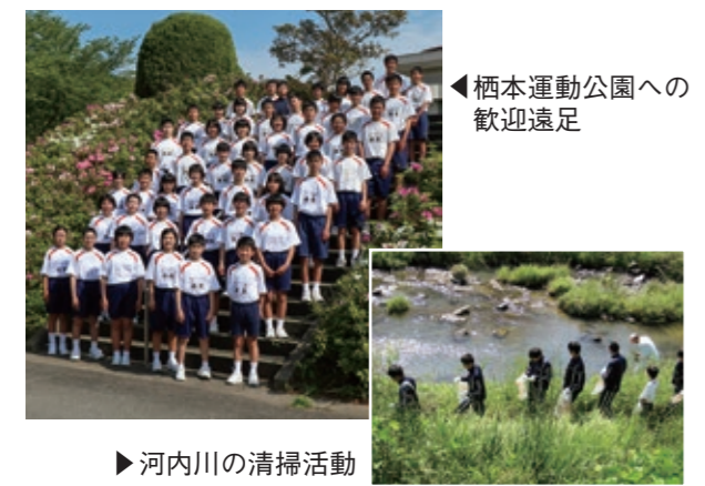
◀ 栖本運動公園への 歓迎遠足