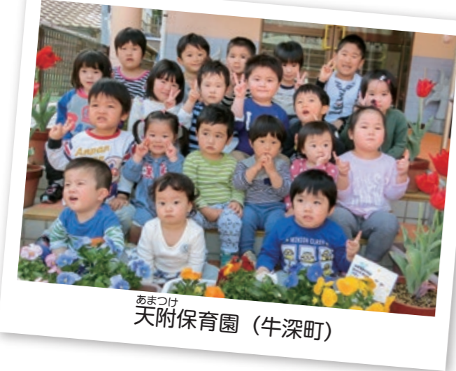
あまつけ 天附保育園 (牛深町)