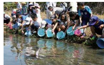
▲アユの稚魚3,000匹を河内川へ

4月22日、栖本町の園児や小・中学生が体長7cmほどに育った稚アユ3,000匹を河内川に放流しました。町民の飲料水を提供してくれる川をきれいにし、鮎が上流まで遡上していたころの環境を取り戻すための取り組みとして同地区振興会が昨年から実施しているもの。子どもたちは、「アユがバケツから飛び出して怖かった」「びちびちと反応がおもしろかった」と話していました。