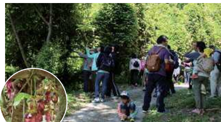
▲アイラトピカズラを探す参加者

4月22日、倉岳町棚底地区で「棚底探検ウォーク」が開かれ、町内外から144人が参加しました。地域の歴史的遺産の伝承と健康づくりを目的に同地区振興会が開催。