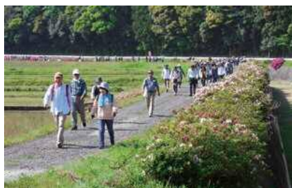
▲つつじと田園風景を楽しむ参加者

4月22日、「芹生の郷 つつじウォーク」が五和町の旧手野小学校を発着とする5kmと10kmのコースで開催され、230人が参加しました。手野地区を流れる内野川の両岸に植えられた約2,100本のつつじをたくさんの人に楽しんでもらいたいと、同地区振興会が昨年度から開催しているもの。