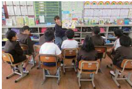
▲地域ボランティアによる本の読み聞かせ

栖本小学校が「読書で日本一」を目標に取り組んでいる活動が認められ、子どもの読書活動優秀実践校の文部科学大臣賞を受賞しました。楽しい雰囲気での飾り付けやコーナーを設けるなど展示を工夫した図書室。市立図書館と連携しての学級内移動図書や地域ボランティアによる読み聞かせなどを行った結果、ここ6年で1人当たりの年間図書貸出冊数は4倍以上の140冊に。学力の向上にもつながっている栖本っ子に注目です。