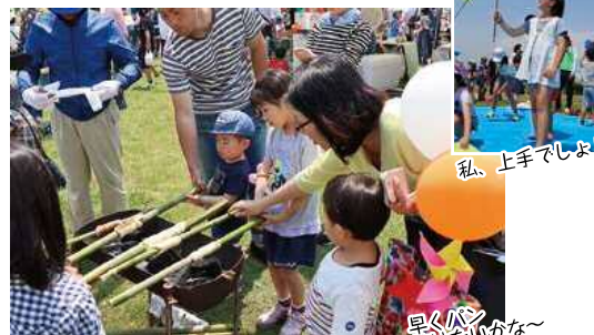
私、上手でしょ!? 早くパン 焼けないかな~