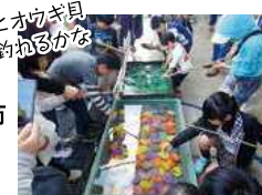
ヒオウギ貝 釣れるかな