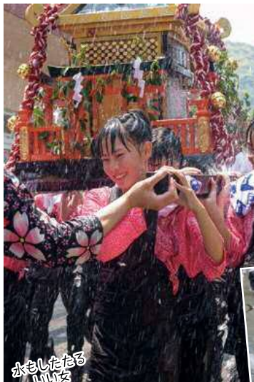
水もしたたる いいな