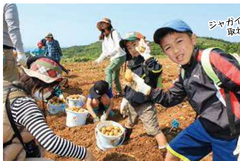
ジャガイモたくさん 取れたよ~