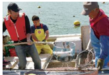
▶網に入った魚をすくい上げる参加者

4月から7月まで有明町大浦地区振興会と漁協が実行委員会を作って実施している「ひと網オーナー制度」。漁船に乗って沖に出たオーナーは、あらかじめ設置しておいた定置網を引き揚げます。ひと網にかかったマダイやヒラメ、ブリ、イカなど全ての魚を持ち帰ることができ、一度に約40kg入ることも。