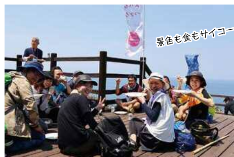
景色も食もサイコー!