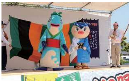
▲(左)初代・(右)二代目のあかねちゃん

4月21日、牛深ハイヤ祭りの記念式典終了後、「二代目あかねちゃん襲名披露式」が行われました。二代目あかねちゃんは、「先代同様に、牛深ハイヤを語り継ぎ、誰もが笑顔になって楽しんでいただけるようがんばります！」とあいさつ。会場は暖かい声援に包まれました。