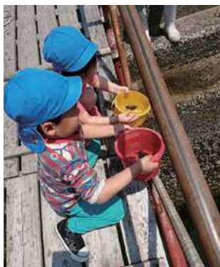
▶ヒラメの稚魚を放流する園児