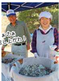
さあぞあ 召し上がれ!