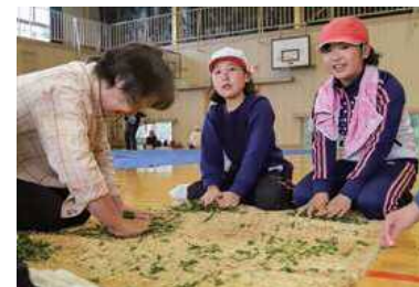
▶釜で煎った葉をむしろの上で手もみ

5月1日、本町小学校の茶園で茶摘みがありました。地元産品や伝統産業を学ぼうと毎年実施しているもので、全校児童72人が保護者や地域の皆さんと黄緑色した茶葉を1枚1枚摘んで約10kgを収穫。