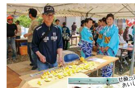
甘酸っぱくて おいしいわ