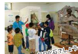
何の化石でしょうか?