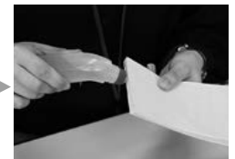
側面にのりを付けて…