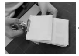
紙をあてクリップではさみしばらく待つと…