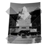
▲写真 表面加工してあるため

家庭や職場でのあなたのひと工夫を教えてください。良いアイデアは、本紙で紹介させていただきます。