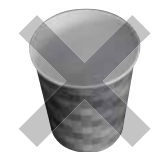
▲紙コップ 防水コーティングしてあるため