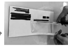
▲セロハン部分を切り取る