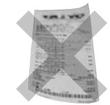
▲レシート 感熱紙は不可