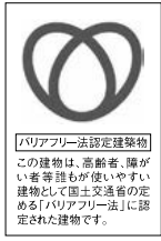
バリアフリー法認定建築物 この建築物は、高齢者、障がい者等が使いやすい建築物として国土交通省の定める「バリアフリー法」に認定された建築物です。

●バリアフリー表示制度 高齢者、障がい者など、誰もが使いやすいするためのバリアフリー性を有している建築物。