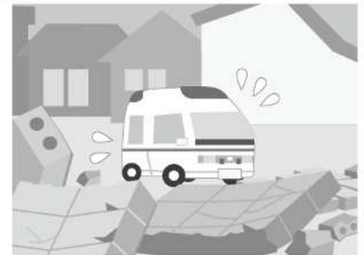
▲緊急車両の通行の妨げになります。

そのようなブロック塀等の安全性の確保は所有者の責任となりますので、まずは、以下の点検表（建築基準法で定められたブロック塀等の構造基準です。）を参考に点検をお願いします。