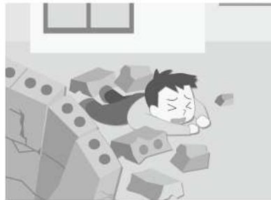
▲倒壊によりけがををする危険があります。