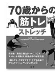
70歳からの 筋トレ&ストレッチ 大淵修一