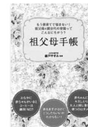
祖父母手帳 森戸やすみ・監修