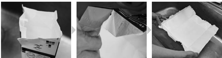
①流し台で口を広げて洗い、側面ののりしろ部分を開ける ②底も同様にのりしろ部分を剥ける ▲紙パックがぬれたまま開くのがポイント！