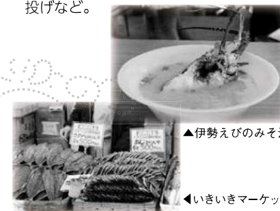
▲伊勢えびのみそ汁