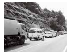
▲クリーンセンター付近の道路の渋滞

例年、年末は大掃除で出るごみを各清掃センターやクリーンセンターに持ち込む人が多くなり、混雑して2時間以上かかる場合があります。ごみは地区のごみステーションに出すか、各センターに持ち込む場合は時間に余裕をもってお越しください。持ち込むときは使用料が必要です(資源物は無料)。 ※持ち込むときも、燃やせるごみ・燃やせないごみ・資源物にきちんと分別してください。