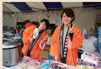
▲代々木公園であった九州物産展に天草ブースを出店