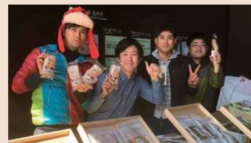
▲杉並区高円寺のマルシェで天草産品を販売