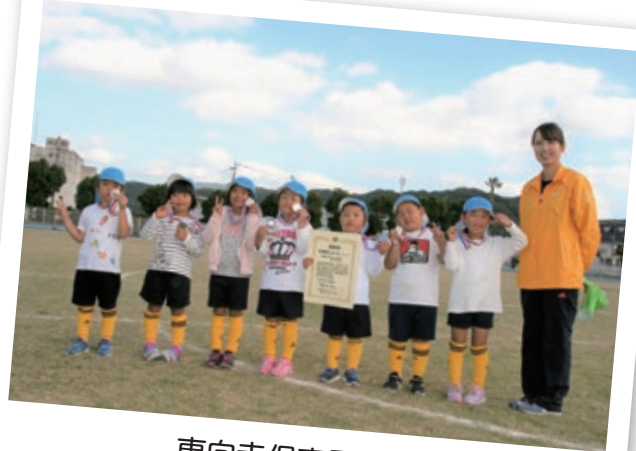
東向寺保育園 (本町)