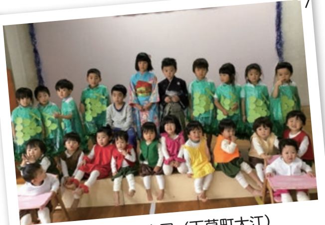
もみじ保育園 (天草町大江)