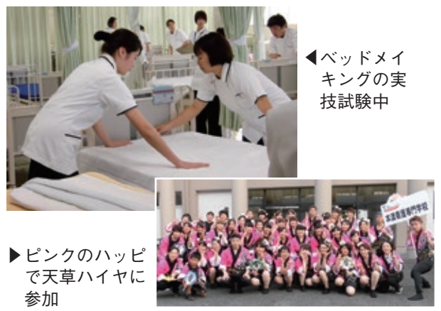
◀ベッドメイキングの実技試験中