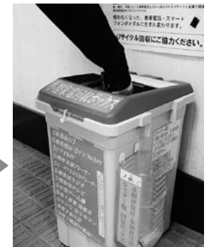
▲拠点回収BOXに入れてください。