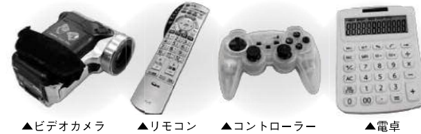
▲ビデオカメラ ▲リモコン ▲コントローラー ▲電卓