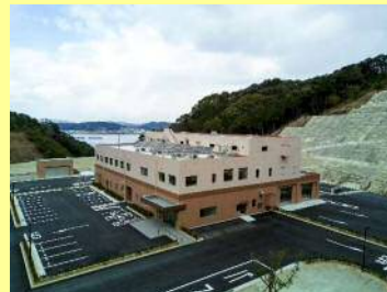
平成29年3月に完成した 天草市汚泥再生処理センター