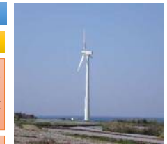
天草市総合交流ターミナル施設 ユメール風力発電施設