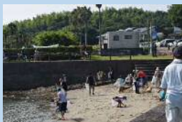
海岸清掃作業のようす