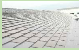
本渡中学校に設置された 太陽光パネル