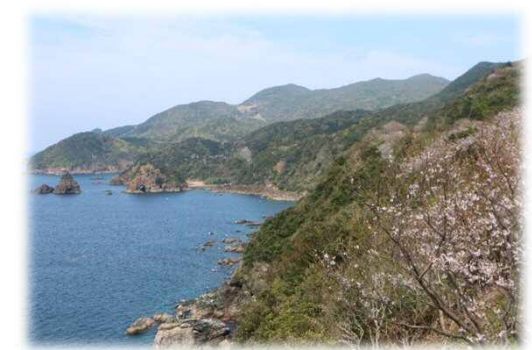
天草西海岸の風景