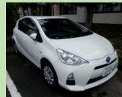
市役所で導入している ハイブリッドカー