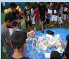
資源物の分別について学ぶ児童たち