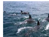
二江沖を泳ぐ ミナミハンドウイルカ