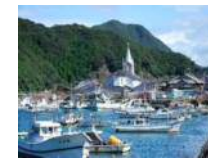
世界遺産に登録された 崎津集落