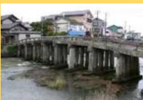
国指定文化財の「祇園橋」