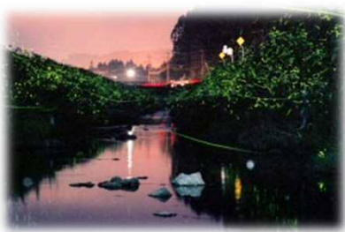
ゲンジボタルが生息する五和町城河原地区の内野川