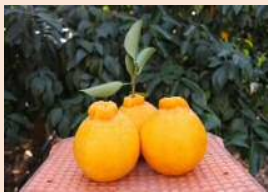
特産品のデコボン