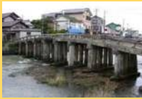
国指定文化財の「祇園橋」

イルカが泳ぐ藍い海 キリシタンの歴史漂うまちなみ 守りつなぐ環境にやさしいまち あまぐわい