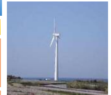
天草市総合交流ターミナル施設 ユメール風力発電施設