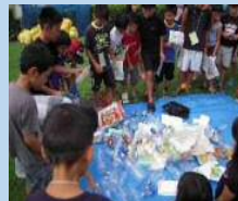
資源物の分別について学ぶ児童たち