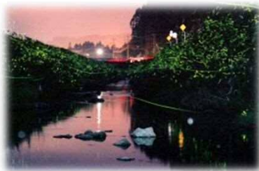
ゲンジボタルが生息する五和町城原地区の内野川