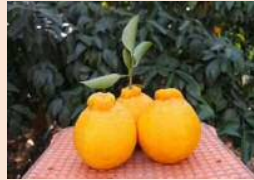
特産品のデコポン