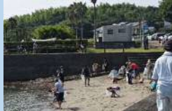
海岸清掃作業の様子