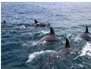
二江沖を泳ぐ ミナミハンドウイルカ