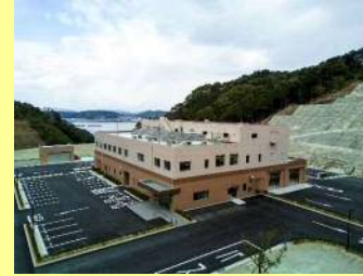
平成29年3月に完成した 天草市汚泥再生処理センター