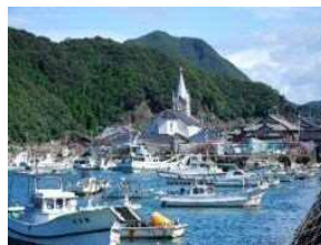
世界遺産に登録された 崎津集落