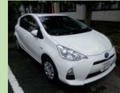
市役所で導入している ハイブリッドカー