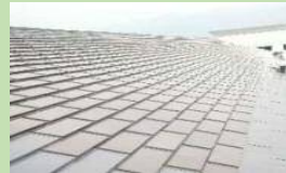
本渡中学校に設置された 太陽光パネル