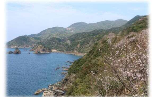
天草西海岸の風景