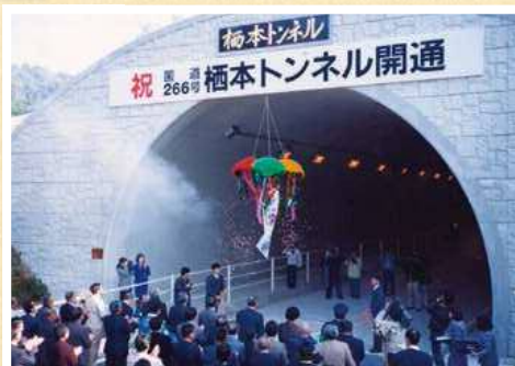
▲柗本トンネル開通 (平成元年12月)