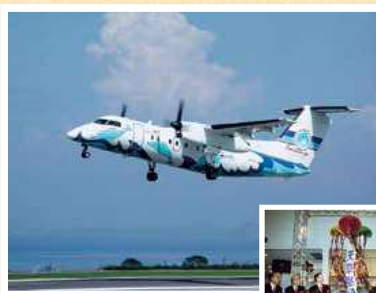
▲天草空港開港 ダッシュ8就航 (平成12年3月)