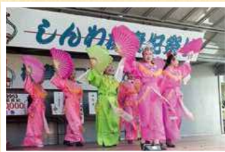
▶第1回しんわ楊貴妃祭り開催 (平成7年11月)