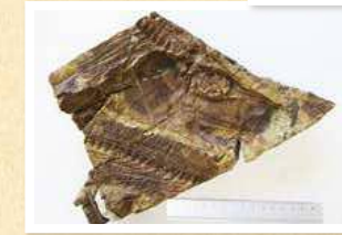
▲アマクサゴショウラムカシウオの化石発見を発表 (平成30年9月)