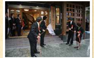
▲下田温泉ふれあい館ぶらっとオープン (平成20年4月)

30年を振り返ると、心に残っているのは小学生からやってきた剣道。勝つ喜び、負ける悔しさを経験し、仲間や恩師と共に努力したことは一生の思い出です。