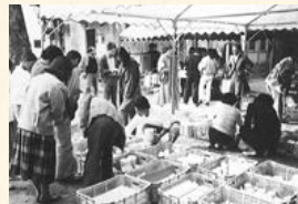
▲賑わいを見せた第1回陶器市

これから新元号になりますが、今後も天草陶石を世の中にもっとアピールできるようがんばっていきます。