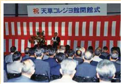
▲天草コレジヨ館開館 (平成2年5月)