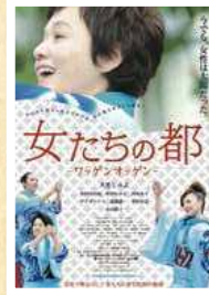
◀ワッゲンオッゲン初公開 (平成23年11月)