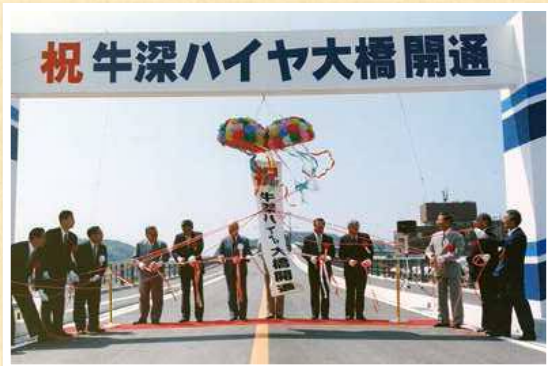
▲牛深ハイヤ大橋開通 (平成9年8月)