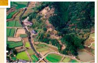
▲棚底城跡が国指定史跡に登録 (平成21年7月)

天草市の平成の歴史、どうだったでしょうか。振り返ってみてこんなこともあったなと懐かしい気持ちになります。もちろん、30年という長い歴史。ここで紹介できなかった出来事もあり、それらは天草アーカイブズで知ることが出来ます。 平成を振り返る企画展「天草・平成のあゆみ展」を6月に開催する予定です。詳しい日程は、市政だより天草でお知らせします。 ◎天草アーカイブズ(五和支所内)