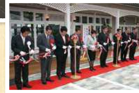
▲鬼池港フェリーターミナル完成 (平成22年3月)