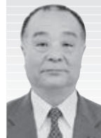
船辺 修 議員