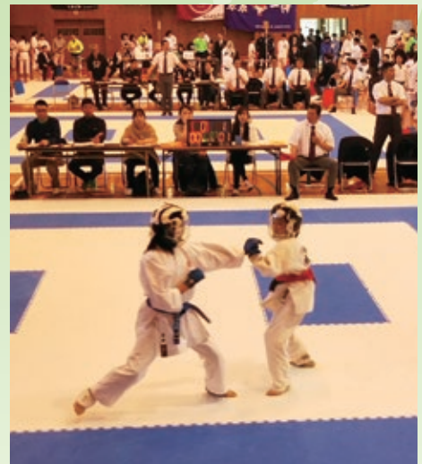
桜まつり親善空手道選手権大会