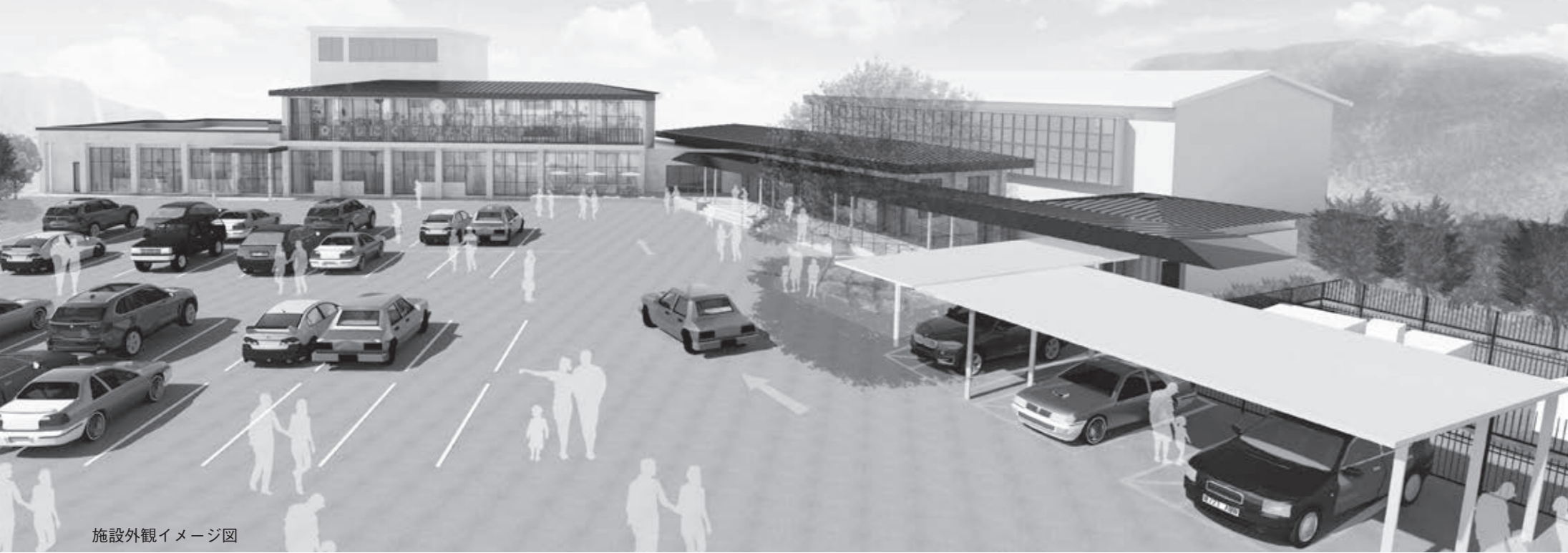
施設外観イメージ図

市においては、運営主体を組織するにあたっては、持続可能な組織となるよう、経営などの専門的知識を有する者の助言を得るなど、同協議会との協議を綿密に行い、地元住民の不安を払拭したうえで、事業を執行するとともに、協議結果及び進捗状況については、その都度議会への報告を行い、情報の共有を図ることを求める。