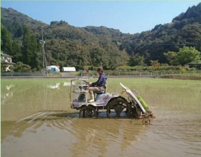
早期米の田植え（二浦町早浦）