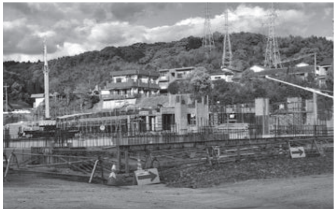
建設が進む複合施設。2020年4月の開館予定。

市長 複合施設の大きなコンセプトは市民交流の場の提供である。図書館においても、市民が行きたくなる図書館、行って楽しくなる図書館づくりを目指しており、利用時間の延長も考えている。