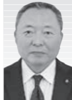
池田 裕之 議員