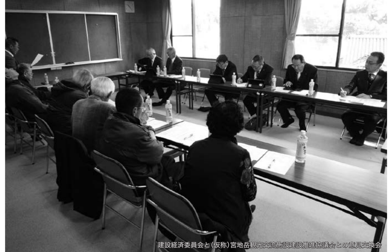
建設経済委員会と(仮称)宮地岳観光交流施設建設推進協議会との意見交換会