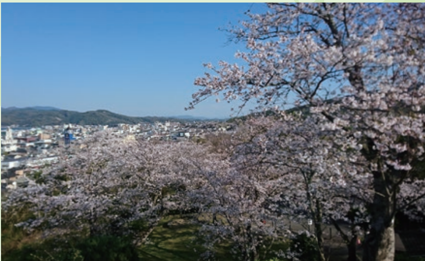
クリシタン館の満開の桜