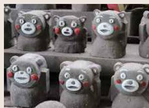
▲同じくまモンでも個性がある