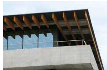
▲屋根の構造材に天草産木材を使用。木材することで軽量化を実現し、各階の耐震壁を減らし、空間を大きく取ることができました