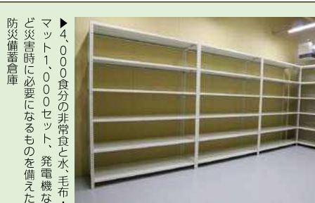
▶4,000食分の非常食と水、毛布、マット1,000セット、発電機など災害時に必要になるものを備えた防災備蓄倉庫