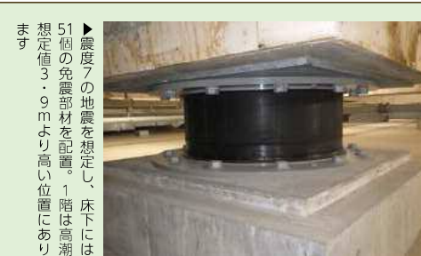
▶震度7の地震を想定し、床下には51個の免震部材を配置。1階は高潮想定値3.9mより高い位置にあります