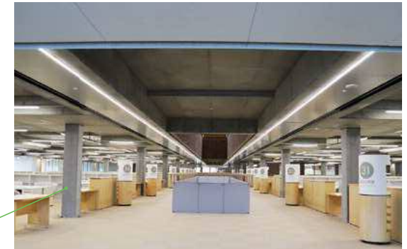
▲部署ごとの壁をなくした執務空間

耐震壁を建物の外周にのみ配置することで、内部の柱のサイズを最小限に抑え、空間を広く使うことができます。