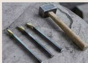
▲彫刻に使用する道具。石のみとかなづち