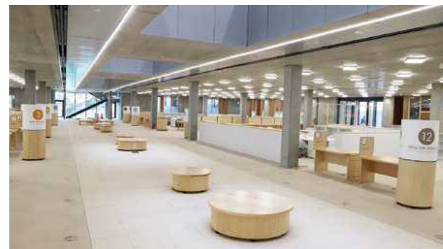
▲1階中央のアマクサン広場