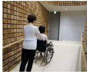
▲車椅子の人も利用しやすいスロープ