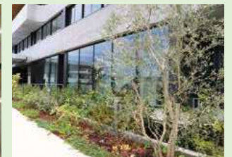
▲庁舎の周りには椿やオリーブなど約30種類の植物が。1年中庁舎を彩ります