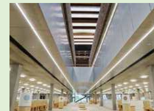
▲3階まで続く吹き抜けは24時間自動で換気。熱い空気を外へ逃がします

庁舎の外側には四季折々に咲く植物が植えられています。LED電球などの使用により同規模の建物と比べて13%エネルギーを削減できる計算です。