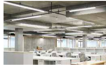
▲天井板をなくし、上の階の床を天井とすることで高さを確保。天井板落下のリスクも軽減します

執務空間は関係部署との連携やコミュニケーションが図りやすいようオープンフロアに。部署ごとの壁をなくし将来的な組織の変更にも対応しやすいつくりをしました。