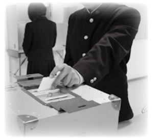
▲18歳から投票できます

満18歳以上(平成14年3月23日までに生まれた人)で令和元年12月4日までに天草市に転入手続きをし、引き続き住民票がある人。 ※12月5日以降に本市に転入した人は、転入前の住所地の選挙人名簿に登録されていれば、投票用紙を請求し、本市で不在者投票ができます。 ※投票日当日、投票所へ行けない人は、「期日前投票」「不在者投票」を利用してください。