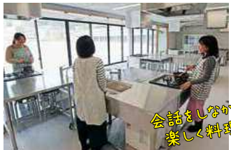
会話をしながら 楽しく料理