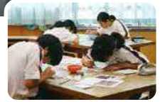
▲中学生の絵付けの様子