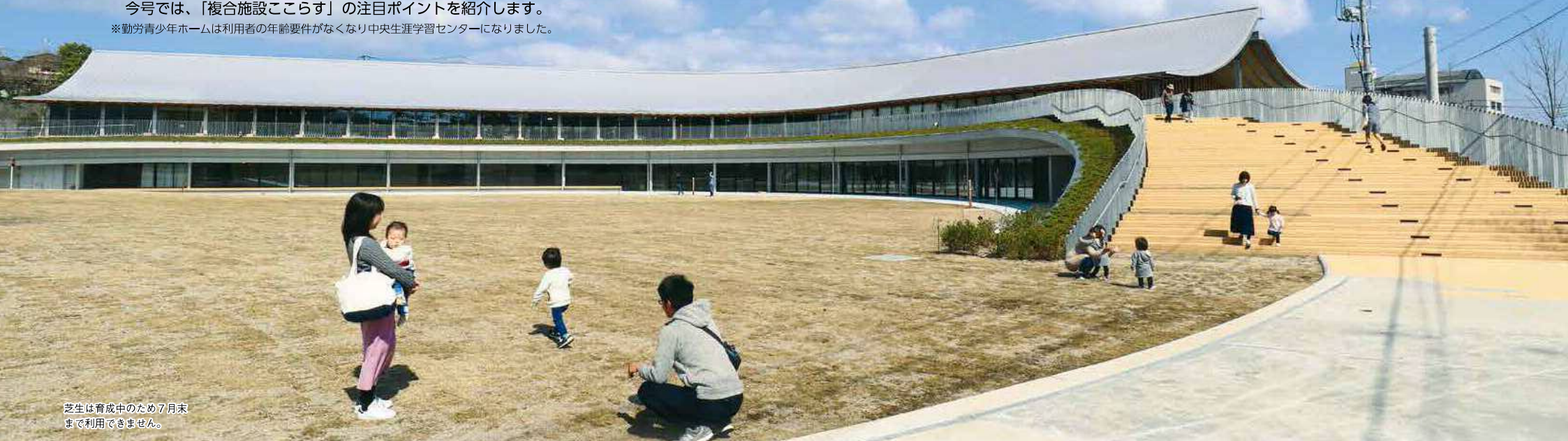
芝生は育成中のため7月末まで利用できません。

※勤労青少年ホームは利用者の年齢要件がなくなり中央生涯学習センターになりました。