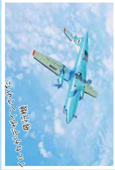
イルカがアゲインされた 飛行機