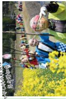
お祭りの長は 鯉魚様です