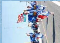
4月 牛深ハイヤ祭り