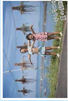
千しタコは 夏の風物詩