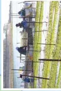
油に広がる鱈のじゅうたん アオサ