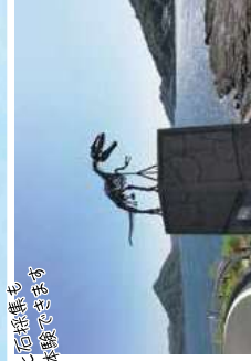
化石探検も 体験できます