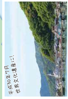
平成30年7月 世界文化遺産に！