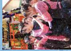
5月 下田温泉祭(天草)