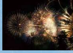
8月 本渡ハイヤ祭り