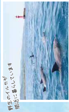
野生のイルカが 間近に暮らしています