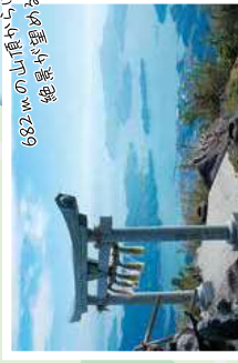
682mの山頂からは 絶景が望める