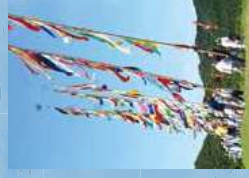
7月 虫追い祭り(河浦)