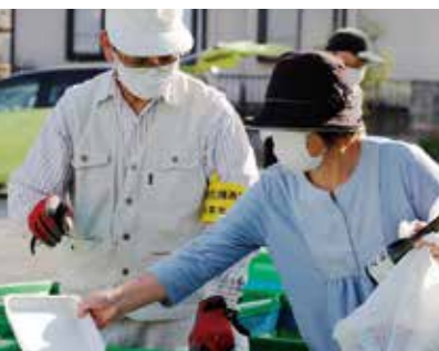
▲分別方法を教える環境美化推進員さん2人