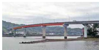
▲⑤天草瀬戸大橋（本渡）