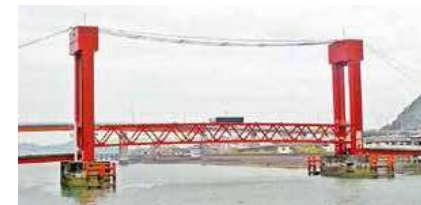
▲②瀬戸歩道橋（本渡）※風速15m/sで通行止め