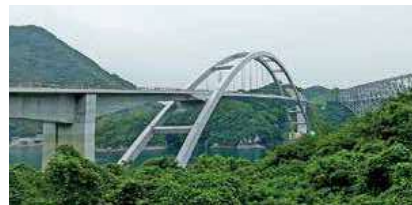
▲①天城橋（三角大矢野道路）※風速15m/sで通行止め