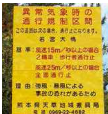
▲通行規制区間を知らせる看板