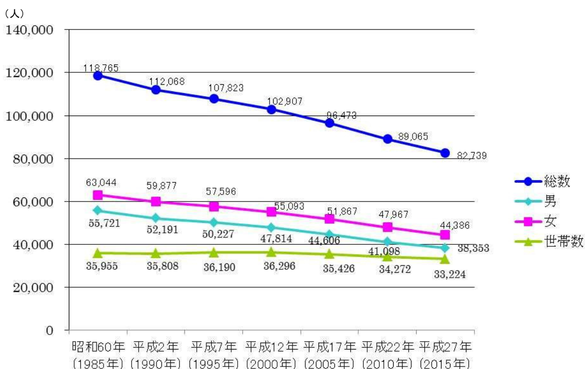
表 1 天草市の人口推移

本圏域は、平成 18 年 3 月 27 日に旧本渡市、旧牛深市、旧有明町、旧御所浦町、旧倉岳町、旧栖本町、旧新和町、旧五和町、旧天草町及び旧河浦町の 2 市 8 町の合併により誕生し、市政運営の基本指針である第 2 次天草市総合計画に掲げるまちづくりの理念「日本の宝島“天草”の創造」を目指して、地域課題の解決に取り組んでいます。特に、コミュニティ活動においては、合併後、市内 51 地区に地区振興会を設置し、各地域の特性を活かした広域的な取組みを進めるなど新しい可能性が生まれています。