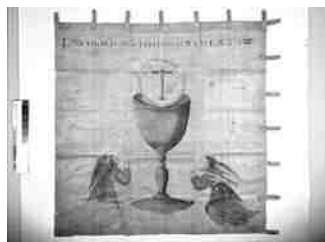
▲「縞子地著色聖体秘蹟図指物 (通称:天草四郎陣中旗)」