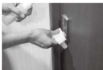
手で触れる共有部分の消毒