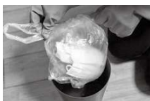
ごみは袋の口をよくしばる