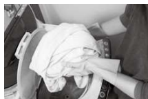
体液で汚れたリネンなどを扱う際は、手袋とマスクをつける

ドアの取っ手などの共用部分は薄めた市販の家庭用塩素系漂白剤で拭いたあと、水拭き。トイレなどの掃除は通常の家庭用洗剤で洗った後、家庭用消毒剤でこまめな消毒を。