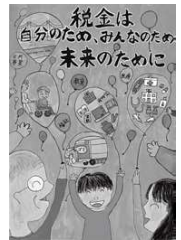
▲国税 ▲県税の早わかり

国では国税のことをホームページで、県では県税のことを冊子で紹介しています（天草広域本部に設置）。