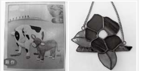
▲押し絵「丑」 ▲ステンドグラス