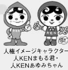
人権イメージキャラクター 人KENまる君、人KENあゆみちゃん

12月4日から10日は人権週間です。この人権週間に合わせ、特設人権相談所を開設。人権擁護委員が、人権問題や家庭問題、金銭問題などの相談に応じます。