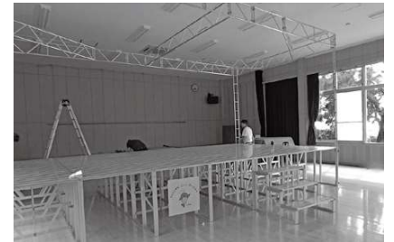
まちづくり支援課 ☎32-6661

この助成事業は、宝くじの社会貢献広報事業費を財源として同センターが助成を決定するもので、コミュニティの健全な発展を図ることを目的としています。