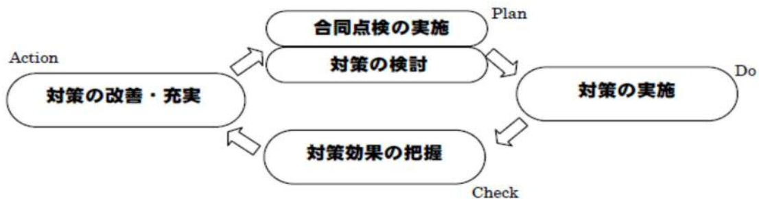
[通学路安全確保のためのPDCAサイクル]

継続的に通学路の安全を確保するため、通学路安全対策プログラムを策定し、これらの取組をPDCAサイクルとして繰り返して安全対策を実施し通学路の安全性の向上を図っていきます。