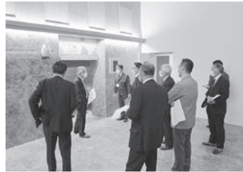
◀市民生活委員会で現地を視察