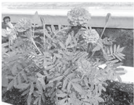
▲『人権の花運動』で、きれいな花を咲かせました

天草市は27名の委員で構成されており、法務局と連携し、地域の皆さんの相談の解決に向けた支援、人権侵害の被害