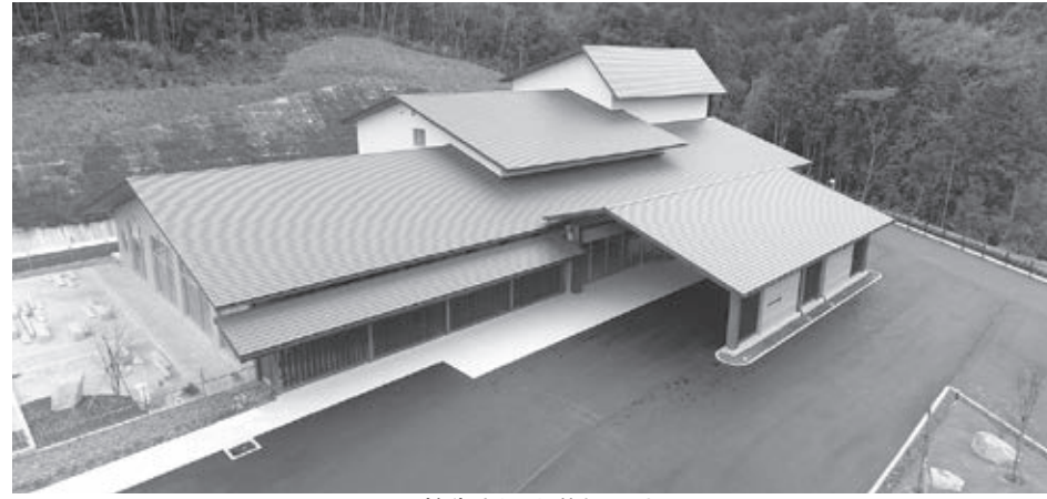
▲(新)牛深火葬場の全景