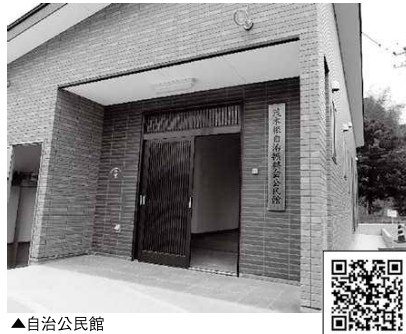
▲自治公民館 ☎まちづくり支援課 ☎32-6661 ▲詳細はこちら

本渡町広瀬茂木根自治振興会では、(一財)自治総合センターのコミュニティ助成事業を活用して、自治公民館の建設と備品の整備を行いました。この助成事業は、宝くじの社会貢献広報事業として、宝くじの受託事業収入を財源として同センターが実施しているものです。