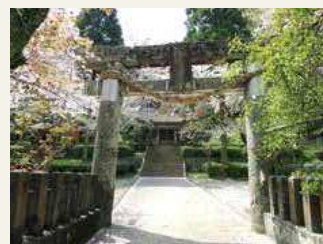
▲崎津諏訪神社 二の鳥居

【その1】 崎津諏訪神社 二の鳥居 神社でありながら潜伏キリシタンが祈った場所として世界文化遺産の構成要素になっている崎津諏訪神社には、現在2つの鳥居が残っています。本殿に近い二の鳥居は、天草に残る鳥居で最も古い年号（1684（1688に建立））を持つ貴重な文化財です。このことから村人の大多数が潜伏キリシタンであったにも関わらず、神社も大切にできたことがよく理解できます。 しかし建立から300年以上経過した現在は金属で補強され、石表面には剥離が見られます。表面の剥離で困るのは碑文が読めなくなること、劣化を食い止める方策が必要と