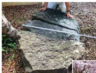
▲発見された貝の化石を含む岩石